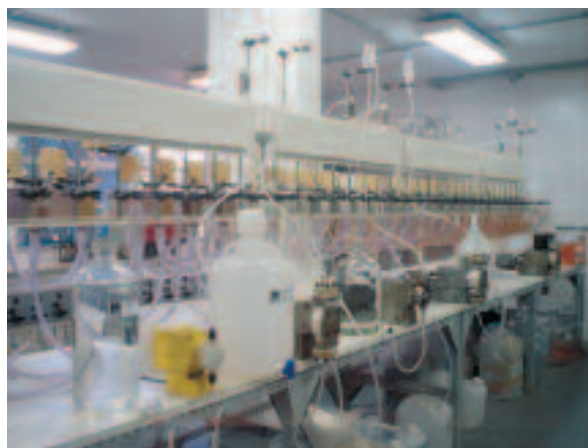
Equipe de Dias da Cunha desenvolve novas tecnologias com processos de separação por solvente

IEN royalties de até meio milhão de dólares por ano, dependendo da capacidade da fábrica a ser instalada.