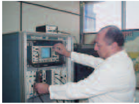
Equipamentos são utilizados em pesquisas ambientais.

Em fase de ensaios e calibração, os novos sistemas têm sido utilizados na de-