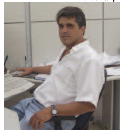
Carvalho: benefícios técnicos e sociais.