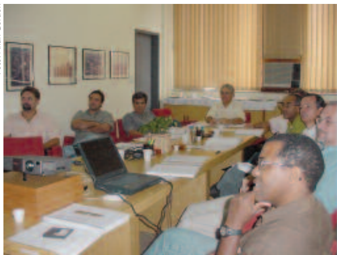
A criação do Conselho Estratégico do IEN, que reúne o superintendente, os chefes de divisão e o GDCl, é uma das iniciativas positivas destacadas na avaliação.