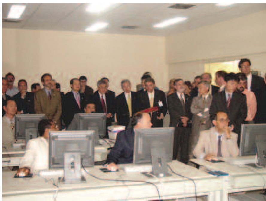
Técnicos brasileiros e coreanos mostram aos convidados algumas das ferramentas do laboratório. Abaixo, a mesa de honra da solenidade de inauguração.