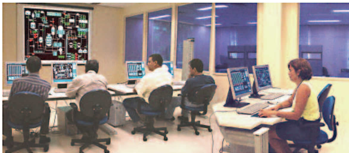
O Labihs tem os mais avançados recursos em análise de confiabilidade.